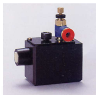
カートリッジ式墨壺

TB-01Aには、密閉式のカートリッジ墨壺を使用しているため時間経過での濃度変化はありません。塗布厚は墨濃度で決まるので、いつも一定の塗布厚になります。